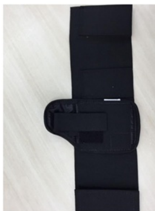
VISTA GERAL – PARTE EXTERNA