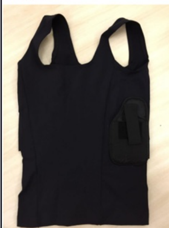
DETALHE DO COLDRE