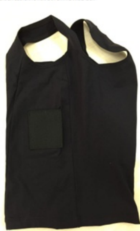
DETALHE DA COSTURA LATERAL E PORTA CARREGADOR