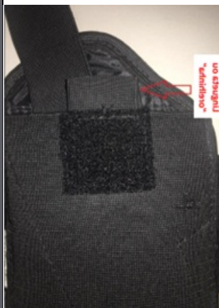
DETALHE DO COLDRE NO CÔS TRASEIRO DO SHORT

- 01 (um) coldre inclinado na cor preta para pistolas Glock 9 mm (nove milímetros) confeccionado em neoplex (espessura 03 mm, base 100% látex, revestimento interno e externo 100% poliéster), elástico 120 mm (composição 75% poliéster e 25% elastodieno, gramatura entre 63,93 a 76,11 g/ml, alongamento entre 105 a 125 %), forrado com tecido sintético impermeável (nylon 70 emborrachado, base 100% PVC revestido com tecido 100% poliamida), com acabamento em viés (largura 22 mm, 100% algodão), com aba externa ("lingueta/orelhinha") em elástico 35 mm (composição 71% poliéster e 29% elastodieno, gramatura entre 16,42 a 19,15 g/ml, alongamento entre 120 a 140 %) para facilitar o coldreamento, com sistema ajustável e removível de retenção de arma confeccionado em elástico 35 mm (composição 71% poliéster e 29% elastodieno, gramatura entre 16,42 a 19,15 g/ml, alongamento entre 120 a 140 %) e sistema de fixadores e fechas (velcro) (100% poliamida, gramatura entre 35,54 a 39,19 g/ml, alongamento 0%) para destra ou canhota a ser definido oportunamente no momento da entrega localizado na lateral posterior do cós; O coldre inclinado deverá ser costurado no short, sem outras aberturas que possam causar erro no local de acondicionar a arma e deverá conter uma "lingueta/orelhinha" com o mesmo material elástico da composição do coldre, com 3,3 cm de largura e 2 cm de altura, em dupla camada (conforme imagem); O coldre deverá